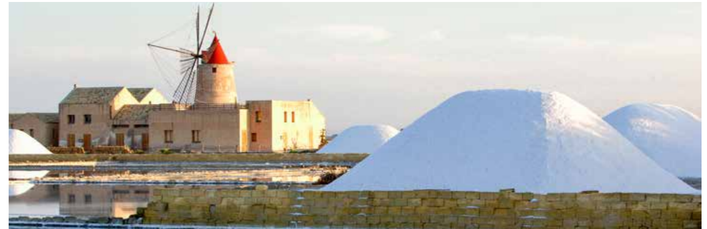
Salinas de la Laguna